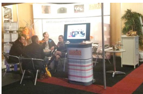
Als standhouder op de GWW Infra-relatiedagen in Hardenberg, Rioleringsvakdagen in Gorinchem en het Forum relinen in Vianen gestaan