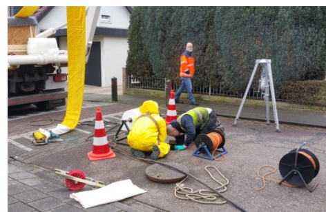
Onze RAW bestekken voor onderhoud en renovatie aan riolen grondig geactualiseerd Toezicht en directie uitgevoerd