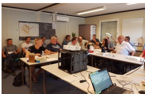
Cursussen ontwikkeld en verzorgd (bij InRIO en in-company)