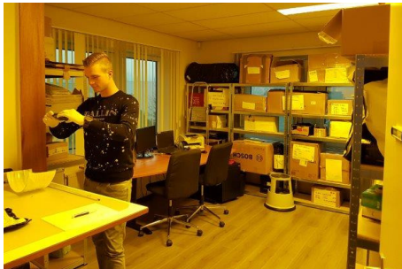
Geconditioneerde en UV-vrije ruimte voor proefstukken ingericht