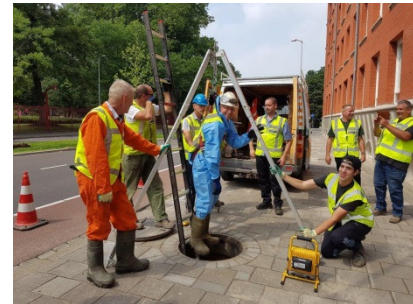
Via bestekken, toezicht en opleiding bijgedragen aan veilig werken