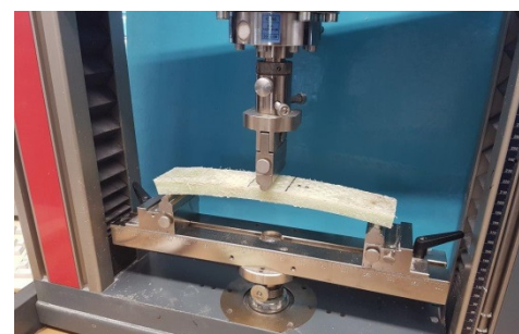
Cursus en excursie bij materiaaltest-laboratorium S+K georganiseerd